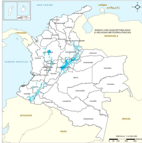
Gráfica 2. Municipios susceptibles a heladas meteorológicas.