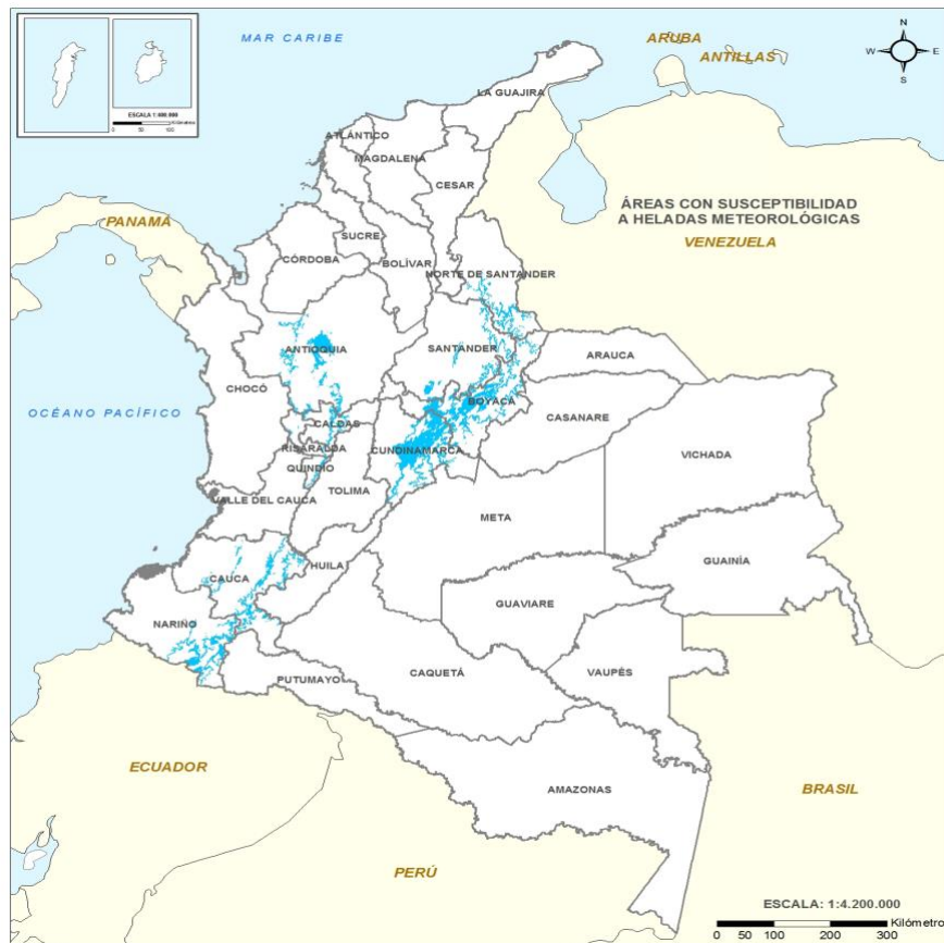
Gráfica 2. Municipios susceptibles a heladas meteorológicas.