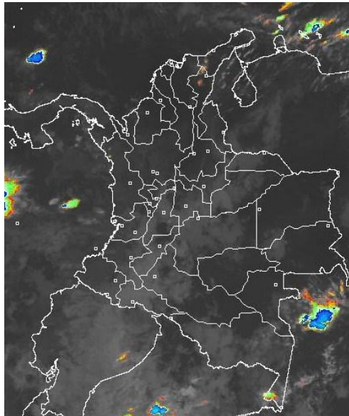
Imagen GOES-13 * 21 de diciembre de 2011 * Hora 8:00 a. m.HLC