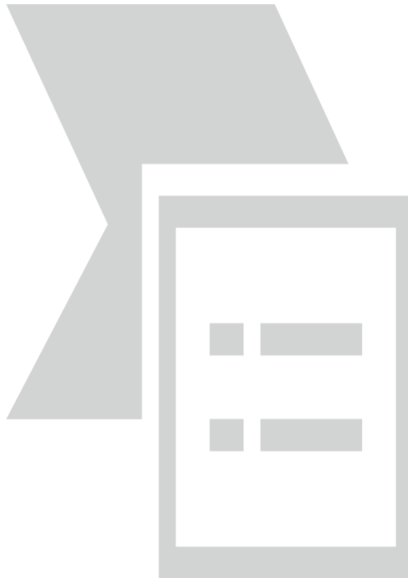
Figura 2. Pronóstico de la amenaza por deslizamientos vigentes 09/06/2022

Baja: Para algunos municipios de los departamentos de la región Caribe, Andina, Amazonía, Orinoquia y Pacífica. (Figura 2)